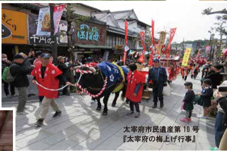
太宰府市民遺産第 10 号 『太宰府の梅上げ行事』