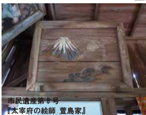
市民遺産第 8 号 『太宰府の絵師 萱島家』