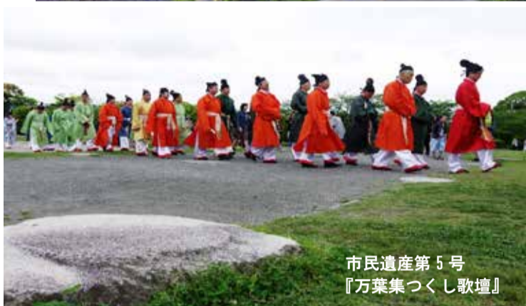
市民遺産第 5 号 『万葉集つくし歌壇』