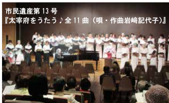
市民遺産第 13 号 『太宰府をうたう』全 11 曲（唄・作曲岩崎記代子）