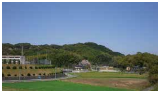
市民遺産第 11 号 『高雄の自然と歴史』