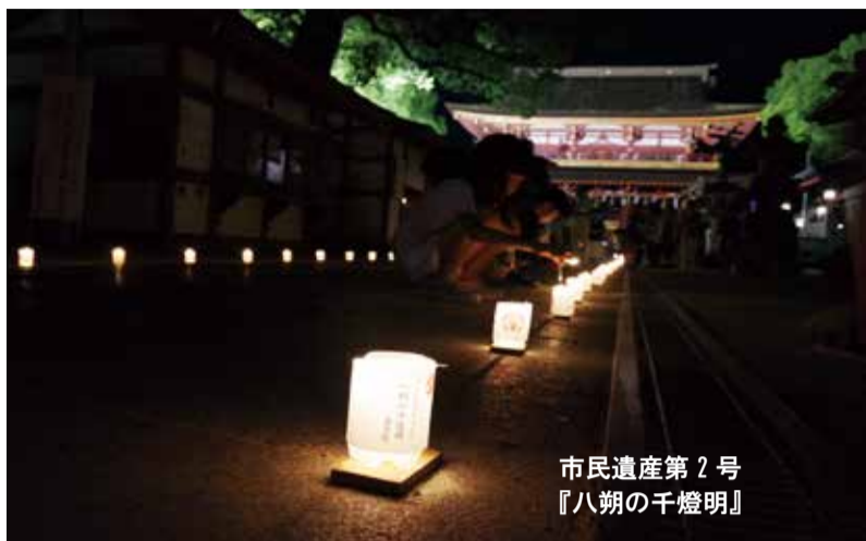
市民遺産第 2 号 『八朔の千燈明』