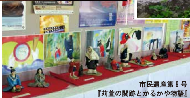
市民遺産第 9 号 『苜萱の関跡とかるかや物語』