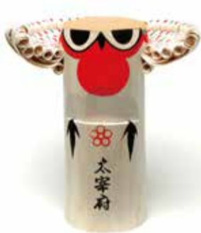
市民遺産第 1 号 『太宰府の木うそ』