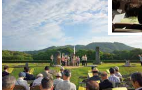
市民遺産第 6 号 『太宰府における時の記念日の行事』