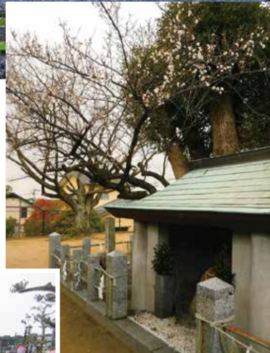
市民遺産第 7 号 『隈麿公のお墓』