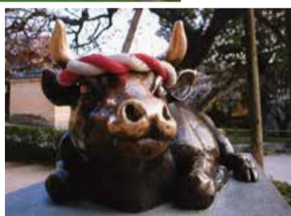
市民遺産第 4 号 『芸術家 富永朝堂』